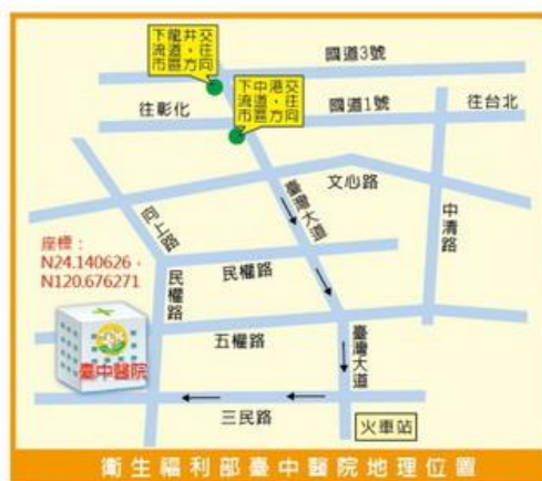
衛生福利部臺中醫院地理位置圖