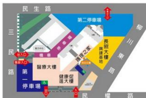
衛生福利部臺中醫院停車場位置圖

搭乘302號公車：臺灣大道仁愛醫院站下車，沿柳川東路步行至民權路左轉進入本院約8分鐘。